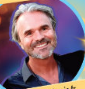
L. Fixaris - fixaris.fr